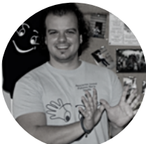
Juan Miguel Gálvez Presidente